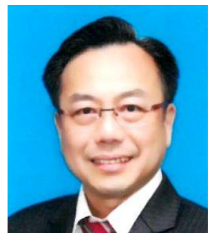
现任总会长拿督陈川正